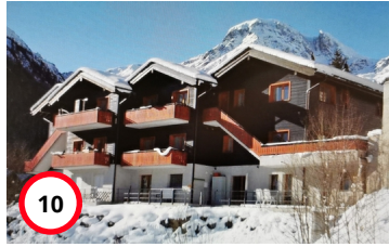
Appartement Platane A7/Grimentz/Anniviers/Valais