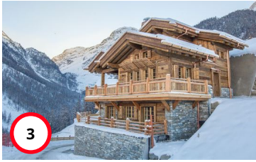
Appartement Adélaïde J No 1 Grimentz/Anniviers/Valais