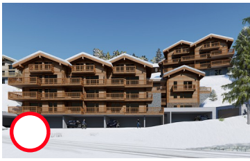
Appartement Tsatela/St-Luc/Anniviers/Valais 740'000.00 sFr. 82.5 m 2 2 chambres