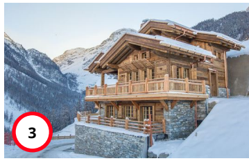
Appartement Adélaïde I No 1 Grimentz/Anniviers/Valais