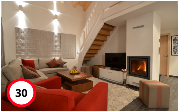
Appartement Piste Rouge 15 Grimentz/Anniviers/Valais